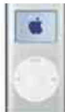
アップル「M9160J/A [HDD オーディオ 4GB]iPod mini」