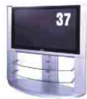
Panasonic 「TH-37PA20 プラズマTV」

【賞品内容】 優勝者(1名) :プラズマテレビ 準優勝者(1名) :JTB 旅行券 3位(1名) :DVD レコーダー 4位(1名) :デジカメ 5位(1名) :iPod mini 6位～10位(5名) :低反発枕テンピュール ラッキーナンバー賞(20名) :“PlayStation2”専用 SIMPLE2000 シリーズ